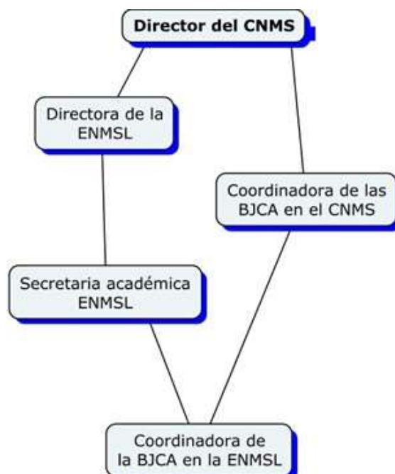
Figura 2. Organigrama de la BJCA en la ENMSL